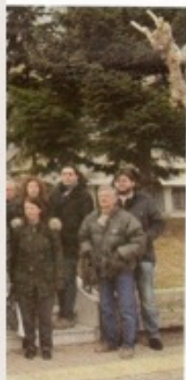
η του Περιφερειακού ς ΕΜΔΥΔΑΣ Θράκης, ραφεία του ΤΣΜΕΔΕ